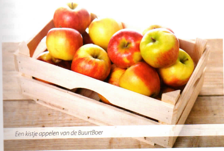
Een kistje appels van de BuurtBoer